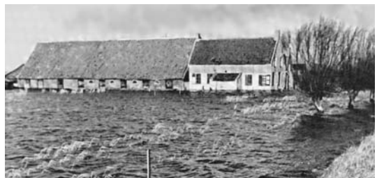
Inundatie Lorredijk, Stad aan 't Haringvliet

In het begin van de oorlog hebben bewoners bij Ooltgensplaat zelf het land onder water gezet met als doel de Duitsers tegen te houden. Lang heeft dat niet geduurd. De boeren konden hun producten van de grasse grond halen. De schade bleef toen beperkt. Dat werd later anders. De