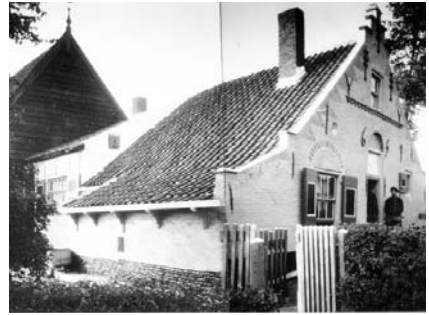
Het Blaeuwe Huus, Ouddorp

In Ouddorp komen ook nog betrekkelijk veel langsdeelschuren voor die los van het woonhuis op het erf zijn gebouwd. Omdat de oudste exemplaren van dit type schuur in Vlaanderen voorkomen, spreekt men ook wel van een Vlaamse schuur. Op Overflakkee komt de Vlaamse schuur nagenoeg niet voor; wel weer op de andere Zuid-Hollandse eilanden en in West- en Midden-Brabant. Ook op Tholen is dit schuurtype inheems. Pas in de 18e eeuw breekt de Vlaamse schuur in Ouddorp door. Vóór die tijd kende het voormalig eilandje Goeree alleen de dwarsdeelschuren. De herbouwde schuur van het Blaeuwe Huus, het huidige VVV-kantoor in Ouddorp, is aan de buitenzijde een mooi voorbeeld van een Vlaamse of langsdeelschuur.